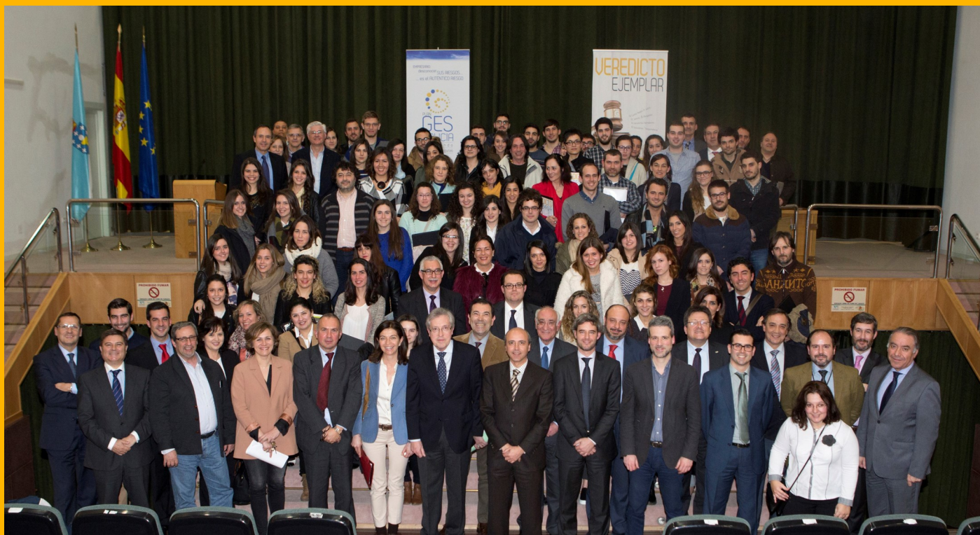
Primera Edición "Veredicto Ejemplar" (2015)

La Universidade da Coruña y Fundación Inade formalizaron en julio de 2014 un convenio de colaboración que estableció un marco de actuación para desarrollar actividades científicas, pedagógicas y de investigación que sean de interés para la sociedad y también para la comunidad universitaria.