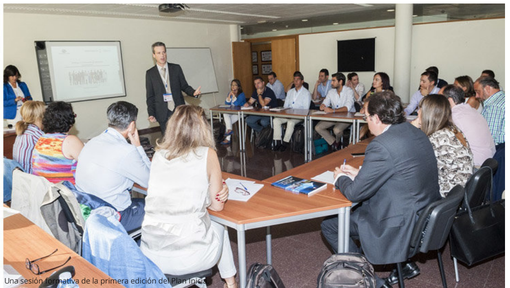
Una sesión formativa de la primera edición del Plan Inicia

La Universidade da Coruña acredita el "Plan Inicia" como curso oficial de posgrado (/articulo/empleo/universidade-da-coruña-acredita-plan-inicia-curso-oficial-posgrado/20160928173929001814.html)